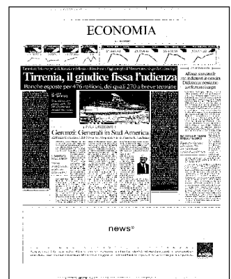
Ritaglio stampa ad uso esclusivo del destinatario, non riproducibile.