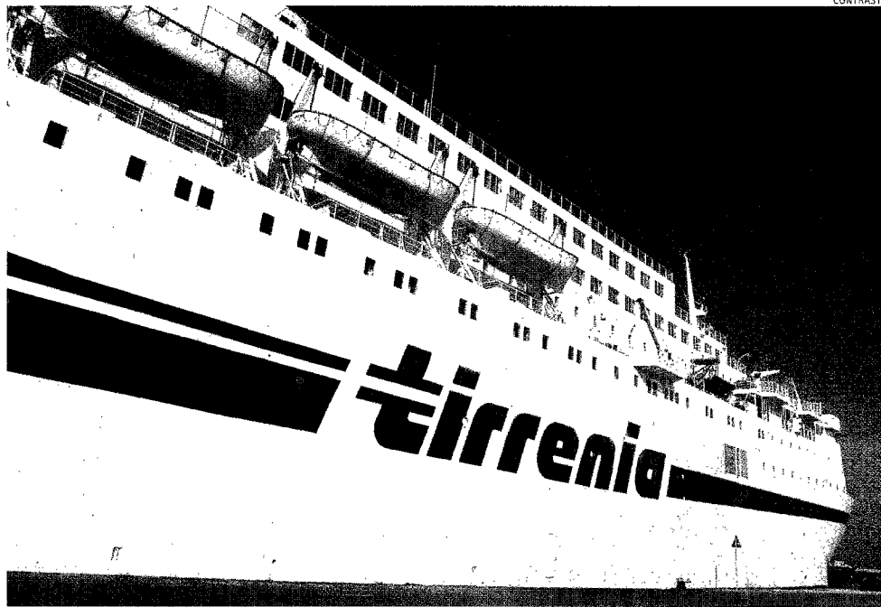
Tirrenia senza acquirenti. Annullata la gara per la privatizzazione della società di navigazione